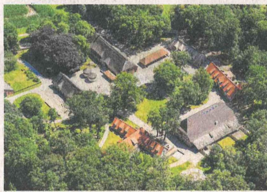
Gut Thansen von oben: Die Gebäude sind kreisförmig angeordnet.